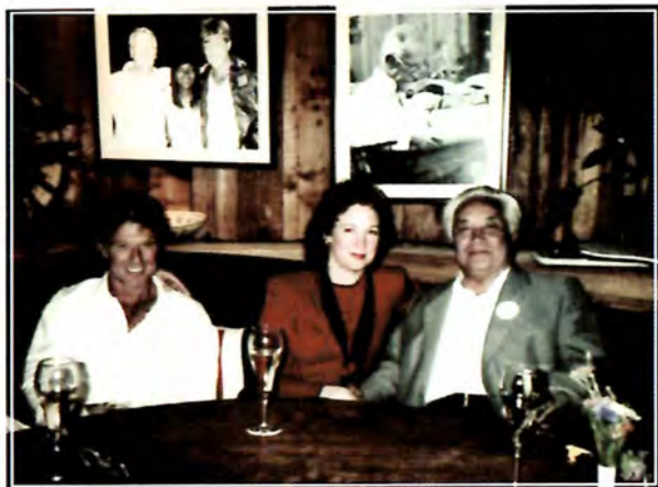
Роберт Ретфорд, Сюзен Эйзенхауэр. АҚШ. Солт-Лейк-Сити, 1990