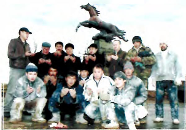
Құлагер ескерткіші алдында бата беру сәті