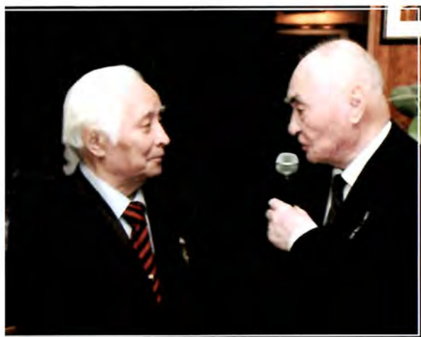
Мемлекет және қоғам қайраткері Б. Әшімовпен бірге. Алматы, 2007