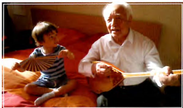
Шөбересі Аянға ән салуда. Соңғы суреттерінің бірі. Мәскеу, 2013