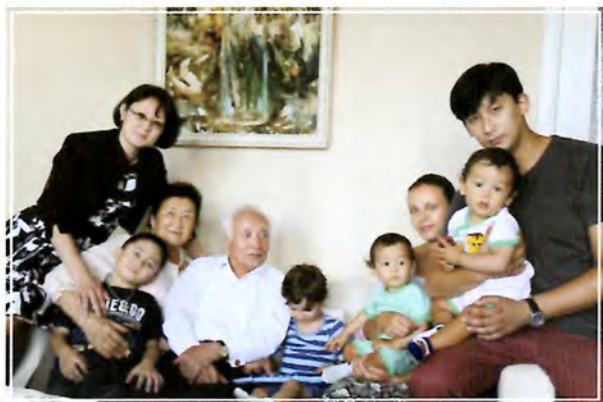
Немере, шөберелерінің ортасында. Мәскеу, 2013