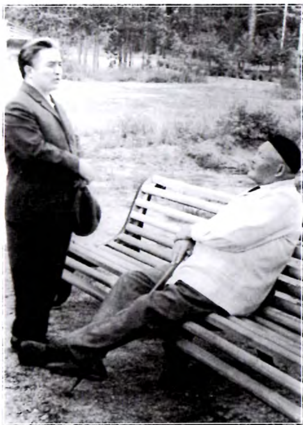
Атақты Сәбит Мұқановпен әңгіме үстінде