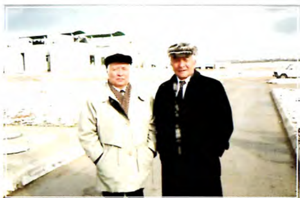
Академик Т. Шармановпен бірге