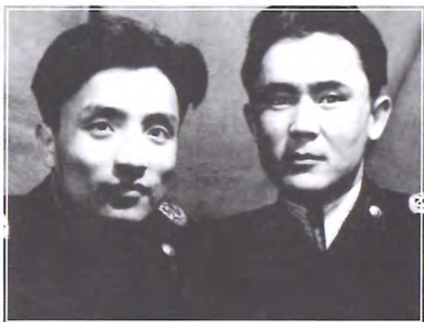
Досы Ж. Қалмағамбетов. Мәскеу, 1950 жылдар