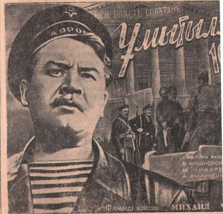
Фильмді қойып МИХАИЛ

СОЛТҮСТІК ҚАЗАҚСТАН ОБЛЫСТЫҚ «ГЛАВКИНОПРОКАТ» жақын арада облыс экрандарында «Ұмытылмас 1919 жыл» суретті жаңа түсті фильм көрсете бастайды.