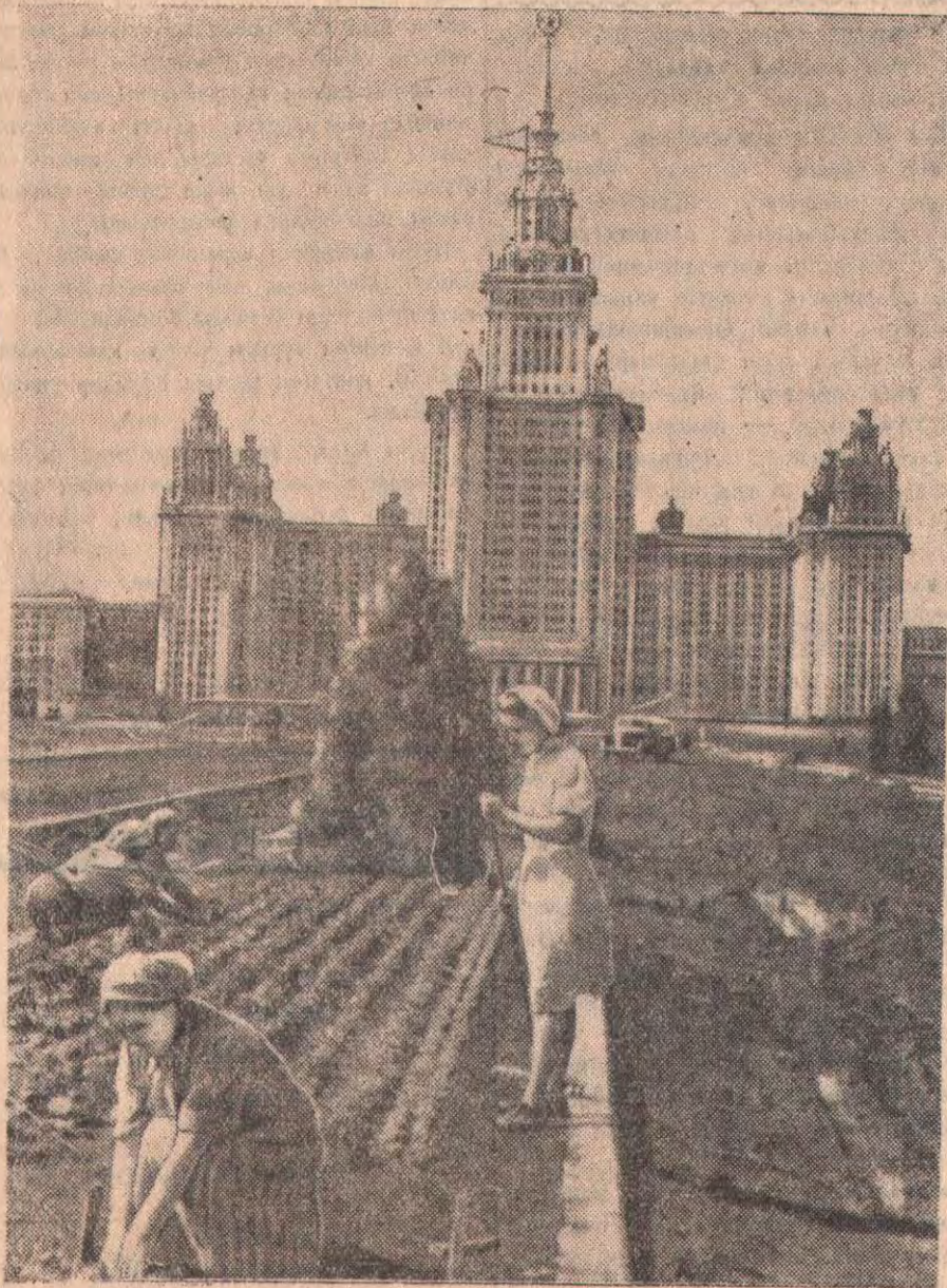
М. В. Ломоносов атындағы Москва университетінің зәулім үйінің алдында үлкен сквер жасалынып, неше түрлі гүлдер егілуде, өсімдіктер отырғызылуда. СУРЕТТЕ: Гүлдер мен шамақты өсімдіктерді отырғызып жүрген бақша-шылар бригадасы.