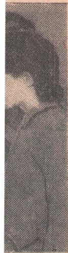
яның XIX ның барлық рымен және н таныстыру хаттайды. меткерлеріне енштейн.

Газеттердің айтуына қарағанда, бұл соғыс шарты бүкіл Бразилияда зор наразылықтар тудыруда. Елде көптеген демонстрациялар өткізіліп жатыр. Оған қатысушылар соғыс шартының жойылуын талап етуде.