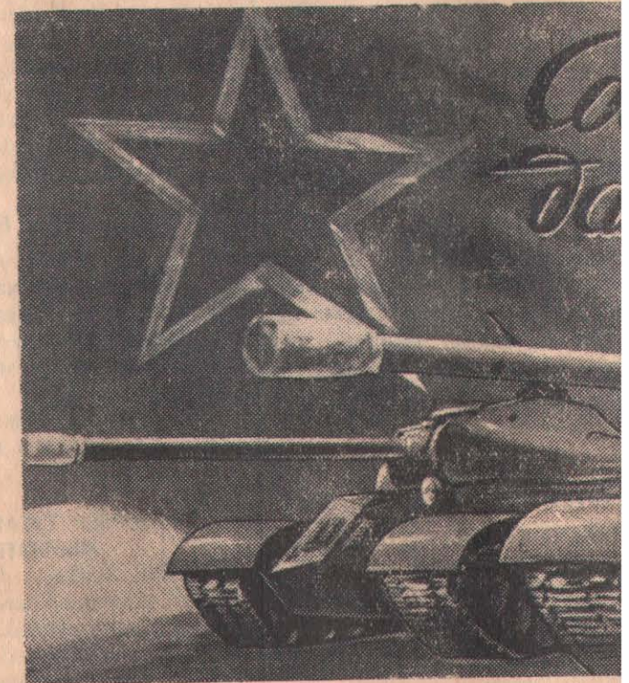
Художник В. Викторовтың «Искусство» баспасы ба

Бұл операциялар және механикаландырылған зор роль атқарып жүзеге асыра от бөлімдер мен күр мен алға басуын совет танкішілері түбінде, оң жақ мен Қырымда және, Белоруссияда участоктерінде п қандауға белсене даған дивизиялар Кишинев операц ше зор роль атқ