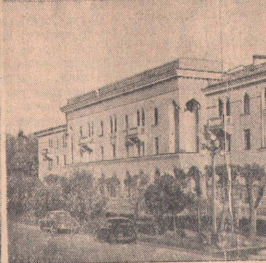
1. 1952 жылғы 5 сентябрьде азамат соғыс Иванович Чапаевтың қаза тапқанына 33 жасының В. И. Чапаев қаза тапқан Чапаев сәткертің орнатылған.