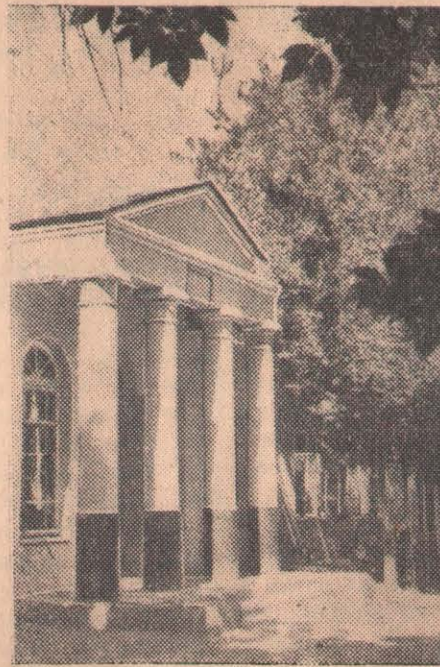
Оңтүстік Қазақстан облысының Пахта- рал совхозындағы емхана үйі.