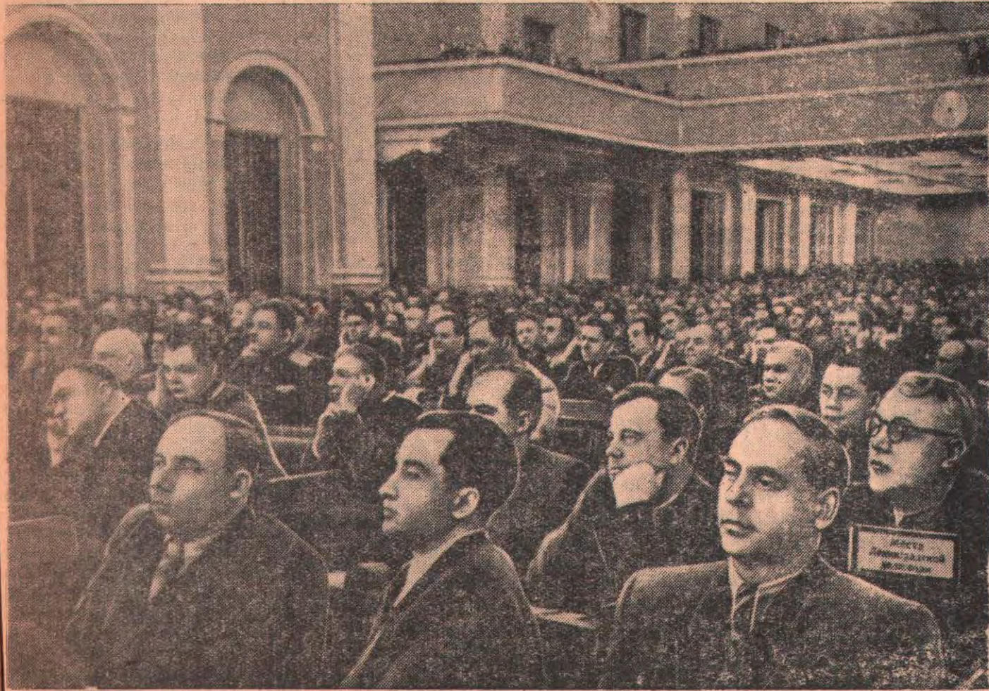
Бүкілодақтық Коммунист (большевик тер) партиясының XIX съезі. СУРЕТТЕ: съездің мәжіліс залында.

БК(б)П Орталық Комитетінің саяси бағыты мен практикалық жұмысы мақұлданды.