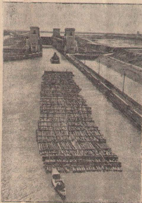
В. И. Ленин атындағы Еділ-Дон кеме қатынасы каналы. СУРЕТТЕ: Еділдің жоғарғы жағынан