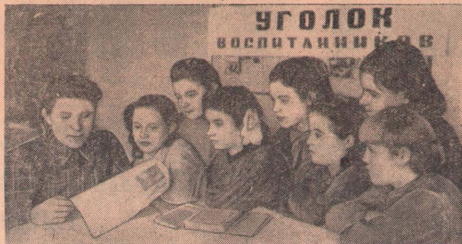
Петропавл ауданының Архангель балалар үйінде тәрбиешілер күн сайын бала- ларға партияның XIX съезінің материалдарын оқып түсіндіруде.

Партия ұйымдарының міндеті, деді Мален- ков жолдас партияның XIX съезінде жаса- ған баяндамасында, идеологиялық жұмыс- ты жете бағаламау сыяқты зиянды әдетті мүлде жою, партия мен мемлекеттің бар- лық буындарында бұл жұмысты күшейту болып табылады. Маленков жолдас «Біз- дің барлық кадрларымыз өмірден артта қалмау және партия міндеттерінің дәре- жесінде болу үшін, бәрі түгел, өздерінің идеологиялық дәрежесін арттыру жолын- да жұмыс істеуге, партияның аса мол