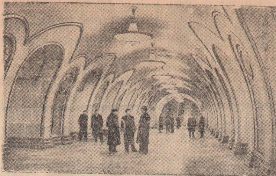
Москва. Метрополитеннің Үлкен айналымындағы адамдар түсетін участка. СУРЕТТЕ: «Новослободск» станциясының жер астындағы вестибюлі.

дин атында- еңбекшілер- ағымдардың колхозының астын өткен па шағым жауап бе- лып отыр. паруашылық