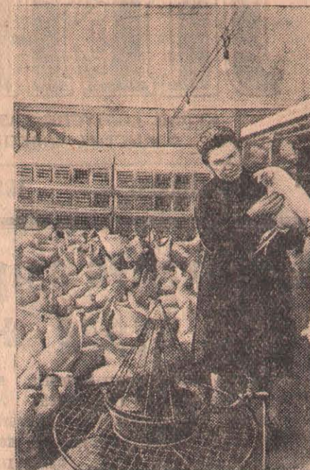
Тамбов облысы. Тұқымдық күс өсіру саласындағы өндіріс жұмысының әдістерін негізінен жетілдіргені үшін Тамбов облысы, «Аржинка» совхозының біртөп қызметкерлеріне Сталиндік сыйлық берілді.