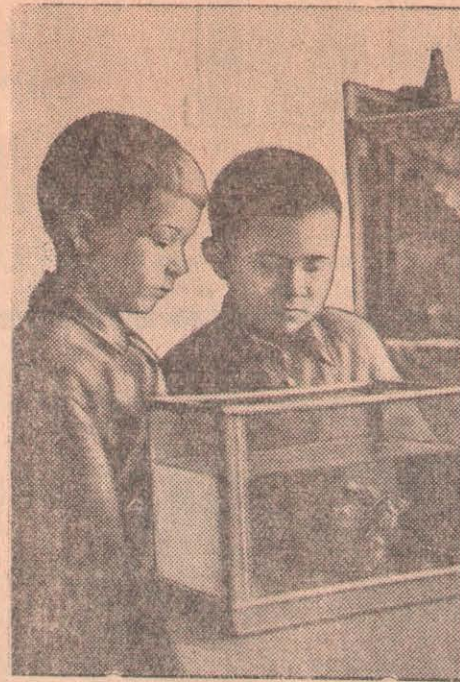
Киров атындағы заводтың балалар бақшасында.