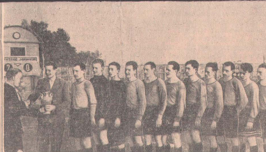
СУРЕТТЕ: жоғарыда — жаңа ашылған «Электрик» стадионының кіреберіс қақпасының көрінісі, төменде — «Электрик» командасына қалалық кубокті тапсыру.

Сессия сайлаушылардың аманаттарын жүзеге асыру мәселесін онан әрі жақсарту беру жөнінде нақтылы шаралар белгіленіп, қаулы алды.