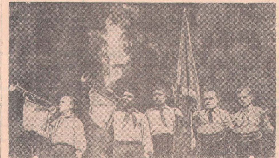
Алғашқы маусымда демалушы барабаншылар мен горн тартушылар.

«Пестрый» лагерінен шыққан көңілді ән кешкі самалмен қала шетінде еміс-еміс естіліп тұрды.