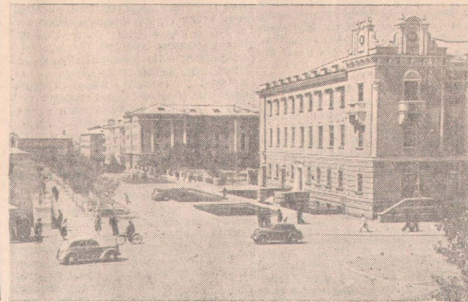
ҚАРАҒАНДЫ. Ленин проспектісі.