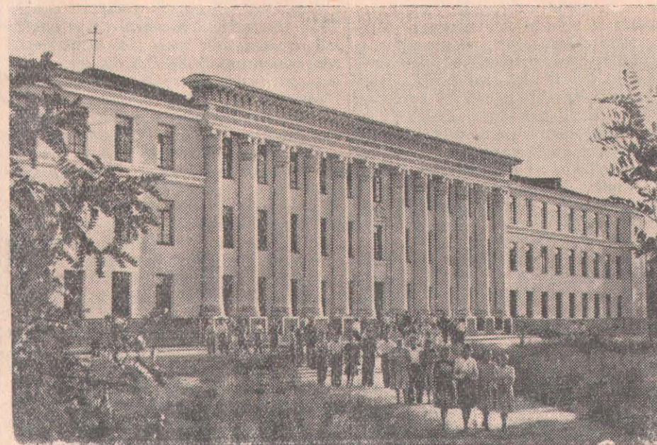
Советтік Қазақстанның қалаларында. Алматы. Қазақтың С. М. Киров атындағы мемлекеттік университетінің жаңа үйі.

Өзінің хош иісті сапасы мен шығымдылығы жағынан темекінің бұл сорты будандастырылған сорттардан кем түспейді. «Дюбек—566» темекісінің ең басты артықшылығы сол, ол мозаикалық және ақұнтақ ауруларына төзімді келеді. Темекі өсірушілер жаңа сортқа жоғары баға беруде. (ҚазТАГ).