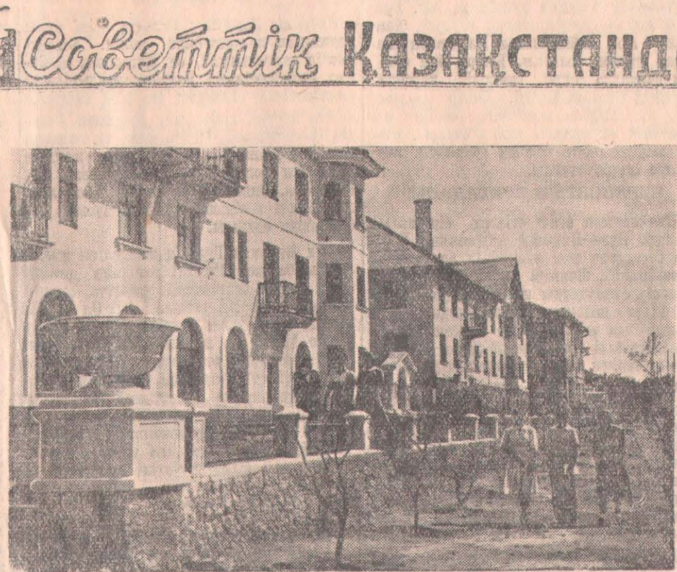
Советтік Қазақстанның қалаларында. АҚТӨБЕ. Карл Либкнехт көшесіндегі жаңа тұрғын үйлер.

Соңғы күндері Куйбышев атындағы, Калинин атындағы және Коновалов МТС-тері 18 жаңа «ДТ—54» тракторларын алды. Осы сияқты бұл станцияларға мал азығындық дақылдар егісі үшін шаршыуылы сеялқалар келді. Кәзір МТС-тер бұрын еш уақытта болмаған су скреперлері, бундзерлер сияқты жаңа техниканың түрлерімен қаруланды. Бұллар механизатор-