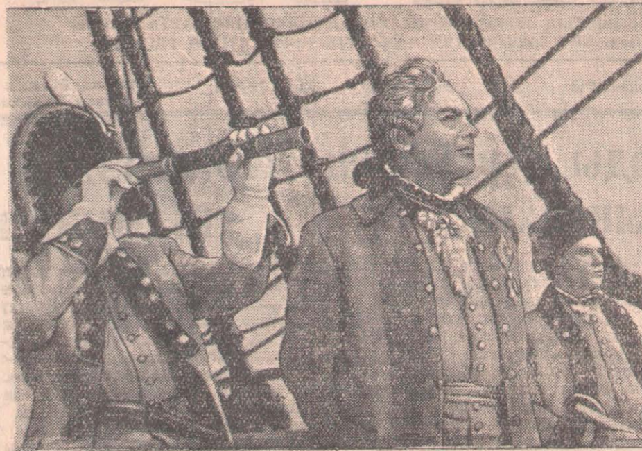
СУРЕТТЕ: «Кемелер қамалдарға шабуыл жасайды» фильмінен кадр.

Қаладағы «Ударник» кинотеатрының экранында «Адмирал Ушаков» фильмінің екінші сериясы — «Кемелер қамалдарға шабуыл жасайды» фильмі көрсетіліп жатыр. Бұл фильм орыстың флот қолбасшысы Федор Федорович Ушаковтың әскери талантын және орыс матростарының ерлік істерін баяндайды.