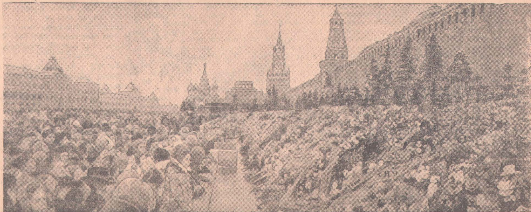
МОСКВА. Қызыл алаң. Совет Одағы еңбекшілерінің Иосиф Виссарионович Сталин жолдасының табыты үстіне салған венюктері.

Ушинский атындағы мұғалімдер институтының бірінші күрсінің студенті.