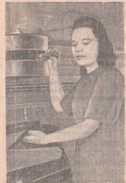
Қала өнеркәсіп орындарының коллективтері арасында I май күрметіндегі социалистік жарыс күннен күнге кеңінен өріс алуда.

Пленум талқыланған мәселе бойынша тиісті қарар қабылданды.