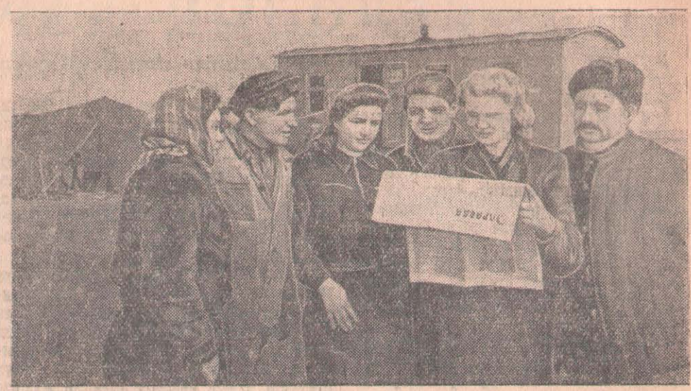
Жаңадан ұйымдастырылған Булаев астық совхозының № 5 трактор бригадасында. Мұнда тракторшылар мен тіркеушілер өздерінің бос уақыттарын газеттер мен журналдар оқуға, түрлі спорт ойындарымен шұғылдануға жұмсайды.

Советтік Украинада, барлық туысқан республикаларындағы сияқты, мәдениет тарихы барлық бүкіл халықтың игілігі болып табылады. СССР-дің 30 мың мектебінде алтыжарым миллионнан аса бала оқыйды. Украинаның 144 жоғары оқу орнын-