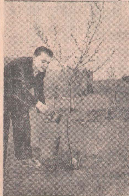
Булаев ауданы, Маленков атындағы жана ұйымдастырылған астық совхозында.

Біз партия оқуы оқу жылындағы ертіхандар мен қорытынды сабақтарды дұрыс ұйымдастыру арқылы коммунистердің маркстік-лениндік білімге деген ынталылықтарын арттыра беруді партия