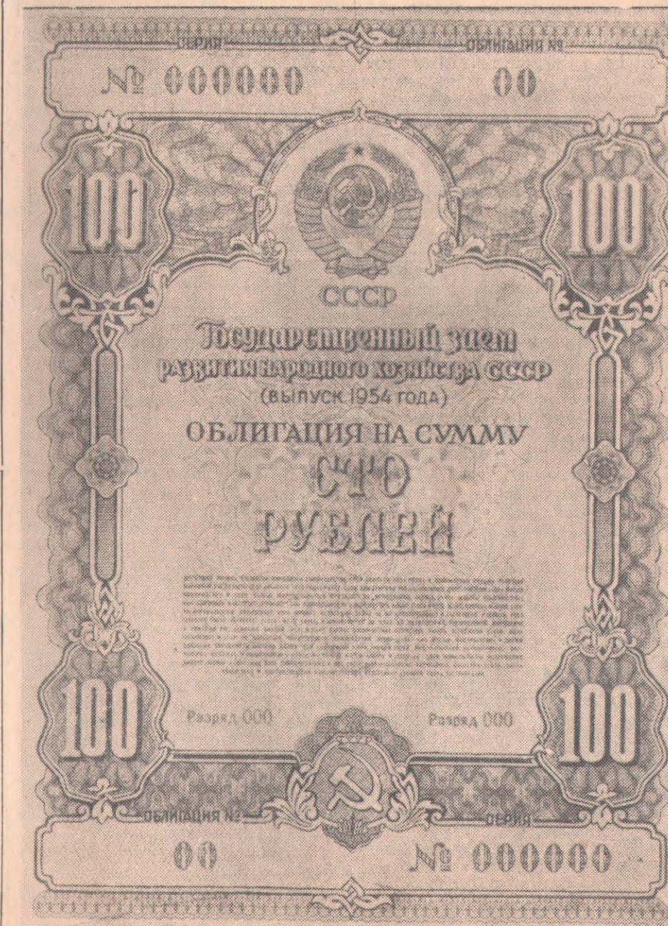
ССРО халық шаруашылығын өркендетудің Мемлекеттік заемның (1954 жылы шығарылуы) 100 сомдық облигациясының үлгісі.

Мұнан соң шығып сөйлеген жолдастар да Үкмет қаулысын қызу қуаттады. Жаңа заемға жазылу бұл заводта зор ұйымшылдықпен өтуде.