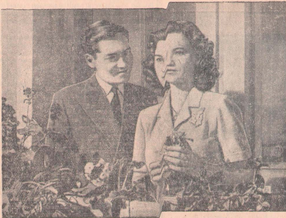
«Бақыт осылай келеді» кинофильмінің кадр.

Қаладағы «Ударник» кинотеатрында Венгрияның мемлекеттік киностудиясы жасап шығарған «Бақыт осылай келеді» кинофильмі көрсетіле бастады.