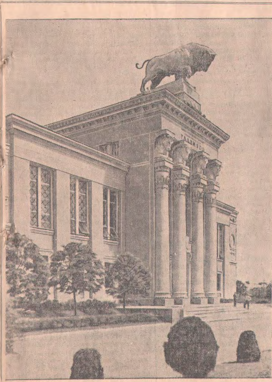
Москва. Бүкілодақтық ауылшаруашылық көрмесі. СУРЕТТЕ: «Главмясо» павильоны.

Барлық жүзуші заводтар жартыжылдық тапсырманы орындады, ал ірі краб консерві заводы «Всеволод Сибирцев» өткен жылғы осы уақытқа қарағанда екі есеге жуық артық өнім берді. Флотилия коллективі балық аулау маусымының аяғына дейін жоспарға қосымша 380 мың пұт краб аулап, оны өңдеу үшін жарысуда.