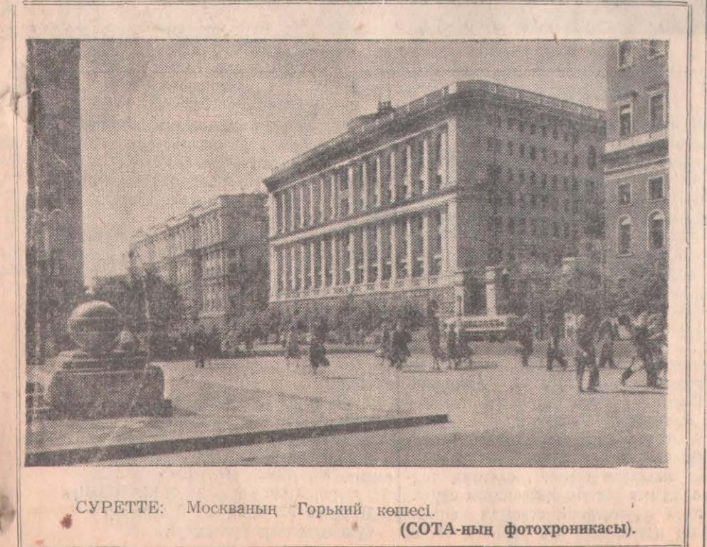
СУРЕТТЕ: Москваның Горький көшесі.