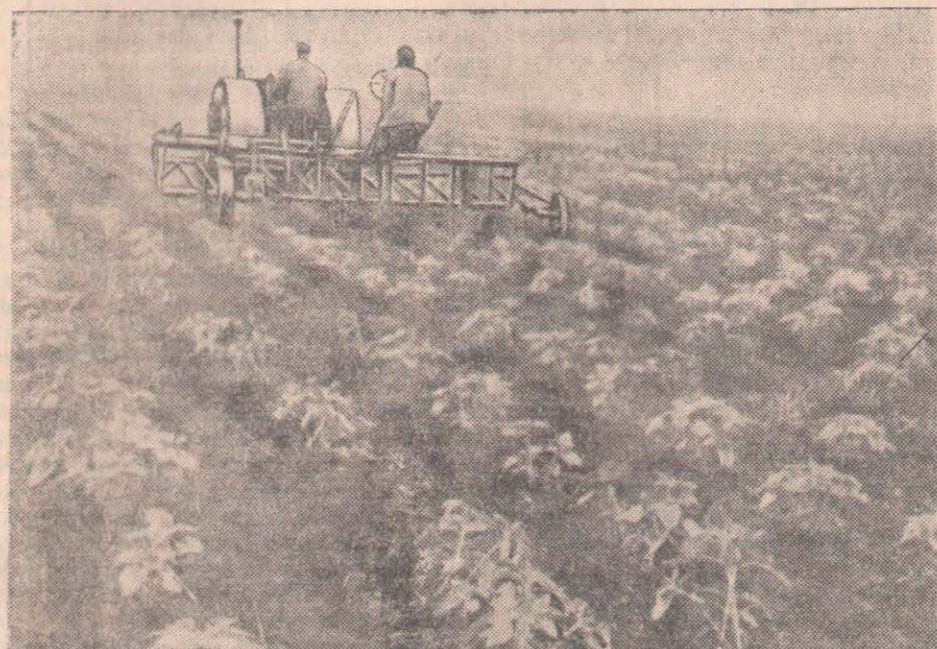
СУРЕТТЕ: Совет ауданындағы «Колос» колхозында күнбағысты культивациялау.

Біздің агрегат мүшелері СОКП Орталық Комитеті Пленумының қаулысы негізінде комбайн агрегатының күндіз тапсырмаларды асыра орындап, астықты көп бастыру жөнінде жарысты өрістету туралы ставропольдіктердің хатымен танысқаннан кейін өздеріне көтерілген міндеттемелер алды. Біз міндеттемізде быйыл тіркеудегі екі «Сталинец-6» комбайнымен 1200 гектар егін жыйнап, 12000 цент-