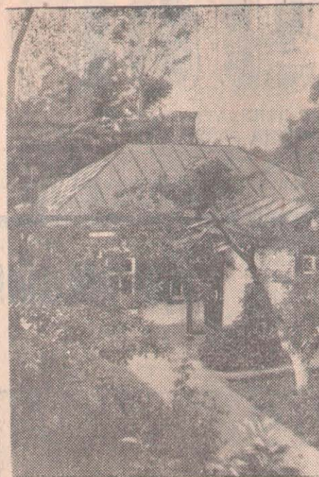
Ростов облысы. Үстіміздегі жылғы 15 июльде орыстың ұлы жазушысы А. П. Чеховтың қайтыс болғанына 50 жыл толады.