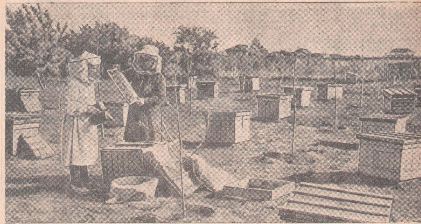
Ленин ауданындағы «Новый путь» колхозында 118 ұя бал арасы бар. Колхоз ара балынан жыл сайын көп кіріс табады. Үстіміздегі жылы мұнда ара ұяларынан 4 тоннаға жуық бал алынбақ. СҮРЕТТЕ: ара өсіретін жерде ара ұяларын байқау.

Мұндай жағдай ең алдымен жайылымдарды дұрыс пайдаланбау, алынған сүттің есебі толық жүрізбеу себепті болып отыр. Сауыншылардың өзара социалистік жарысы формальді түрде ғана ұйымдастырылған. Мал өсірушілердің арасындағы үгіт-буқаралық жұмыстар бетімен жіберілген. Мұнда төлдерді шығынсыз өсірген малшылардың еңбегіне қосымша ақы төлеу ұйымдастырылмаған. Ол ол ма, товарлы-сүт фермасы күні бүгінге дейін сауын-