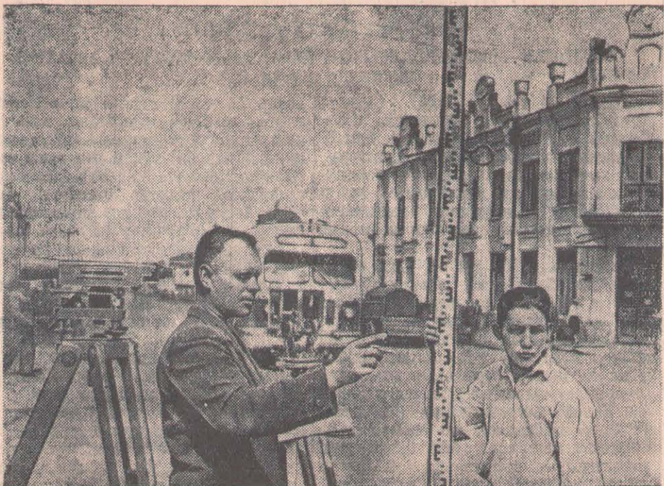
Петропавлда көп қабатты үйлер салынып, пайдалануға беріледі. Қазақтың мемлекеттік құрылыс жоспарлау мекемесінің Петропавл филиалы жаңа үйлерді салудың жобаларын жасау үстінде іздену жұмыстарын жүргізуде. СУРЕТТЕ: қала көшелерін зерттеу.