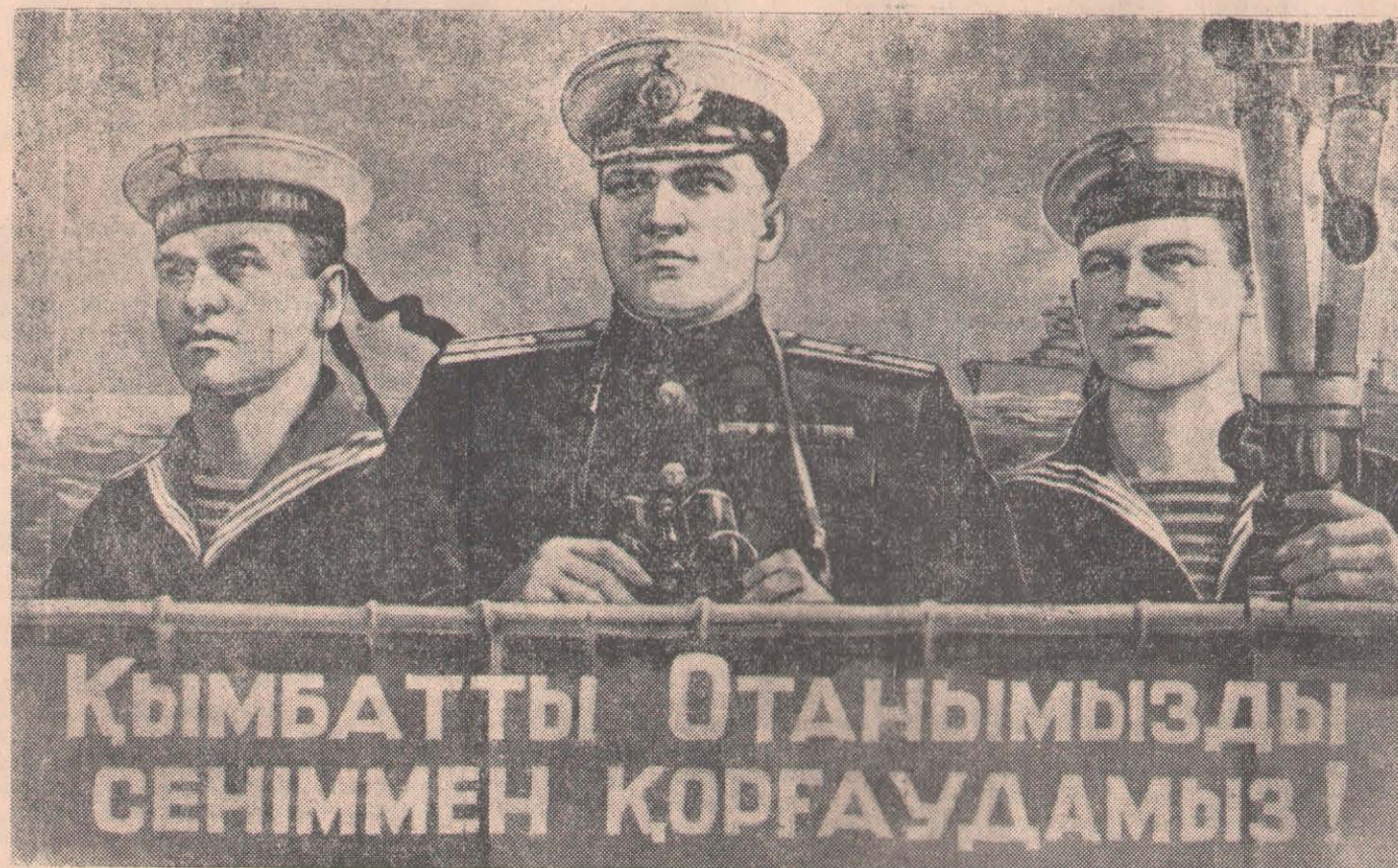
Суретші В. Лыковтың Мемлекеттік бейнеләу искусствосы баспасы басып шығарған плакаты.