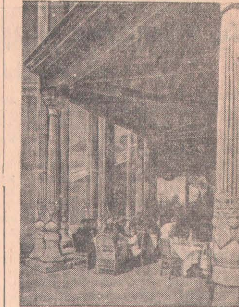
Бүкілодақтық ауылшаруашылық көрмесінде. СУРЕТТЕ: Өзбек ССР павильонының шайханасы.

Бұл жетістікке жетуде машина техникасын өнімді пайдалану жолындағы жарыс айтарлықтай әсерін тигізді. Әрбір екінші механизатор егін орағында еменалық нормасын күн сайын асыра орындап отырды.