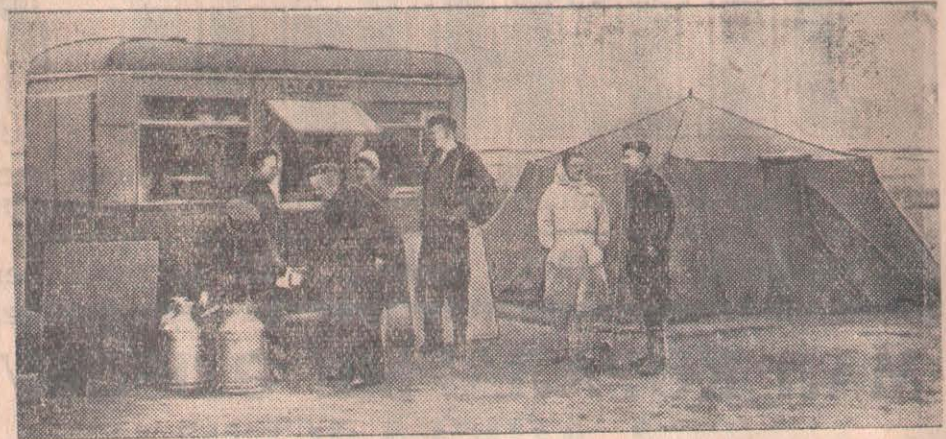
СУРЕТТЕ: Докучаев астық совхозының орталық усадьбасындағы мағазин.

Жаңа шаруашылықтардың бұл табысқа ие болуына партияның шағыруымен келген комсомолецтер мен жастар келелі үлес