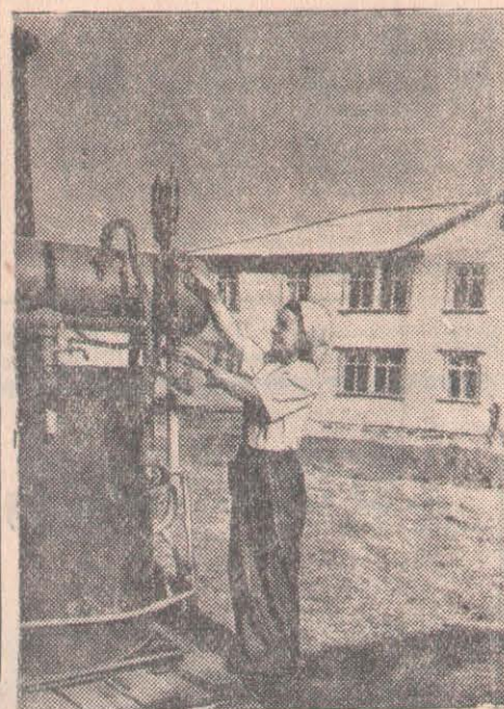
Булаев совхозында трактор бригадалары мәдениетті қамтылады. Онда әрбір трактор бригадасында душ орнатылған.

Қазақстан КП облыстық комитетінің нұсқаушысы.