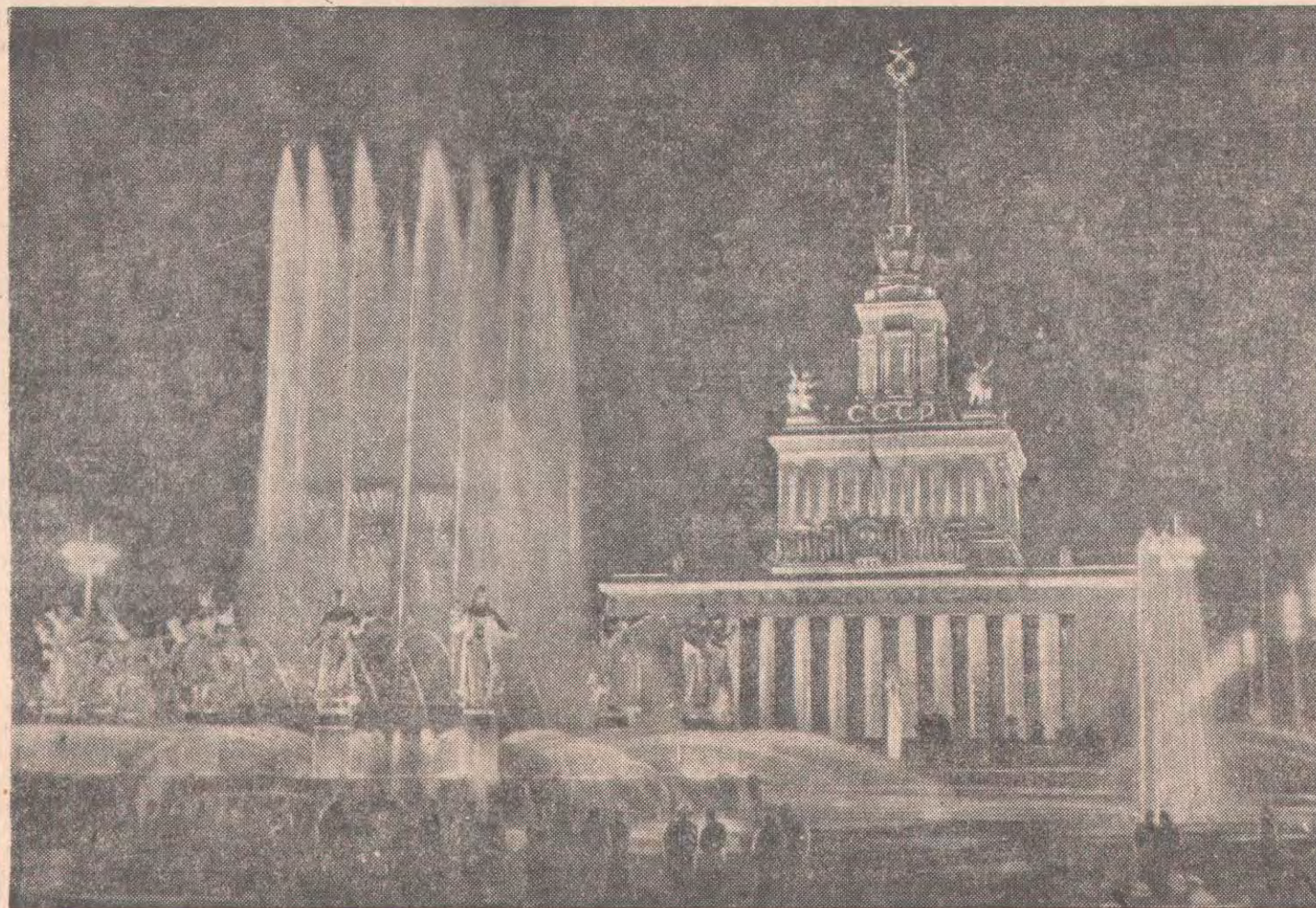
Москва. Бүкілодақтық ауылшаруашылық көрмесінде «Халықтар достығы» фонтаны мен Бас павильонның көрінісі.