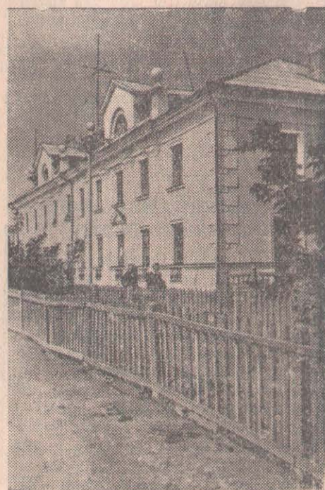
СУРЕТТЕ: Петропавлдағы Моторная көшесінде жұмысшылар мен қызметкерлер үшін жаңадан салынған сегіз пәтерлі үй.