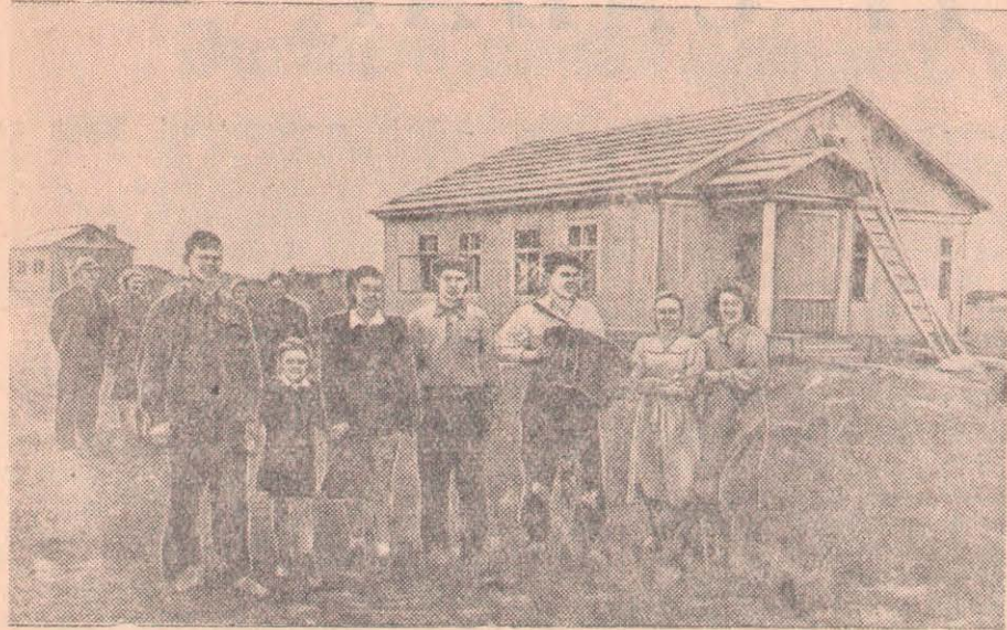
Образцовая МТС-нің орталық усадьбасында кітапхана және демалыс бөлмесі бар. Мұнда үлкен клуб үйі салынып жатыр. Бұл орындар МТС жастарының жұмыстан кейін жыйналып, мәдениетті демалатын сүйікті орнына айналған. СУРЕТТЕ: орталық усадьбада суреттеп жүрген жастардың бір тобы.