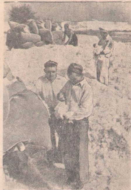
Өзбек ССР. Сурхан-Дарья облысының колхоздарында мақтаны жаппай жыйнау басталды.

СУРЕТТЕ: Дернау қабылдау пунктіне Молотов атындағы колхоздан өнеліңер мақтаның сорттылығын байқау.