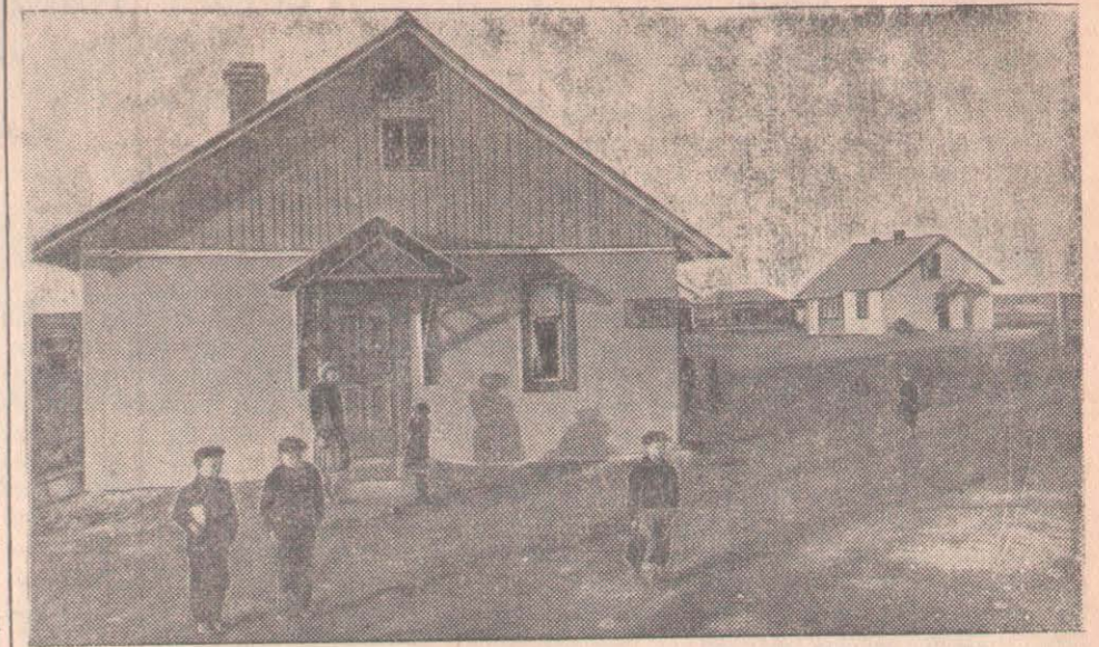
Жаңадан ұйымдастырылған Украина астық совхозындағы мектепте жұмысшылар мен қызметкерлердің балалары оқиды.

Севастополь қорғанысының 100 жылдығын СССР еңбекшілері коммунизм құрылысында жеткен жаңа табыстары жағдайында атап өтуде. Қуатты совет державасы бүкіл дүние жүзіндегі бейбітшілік