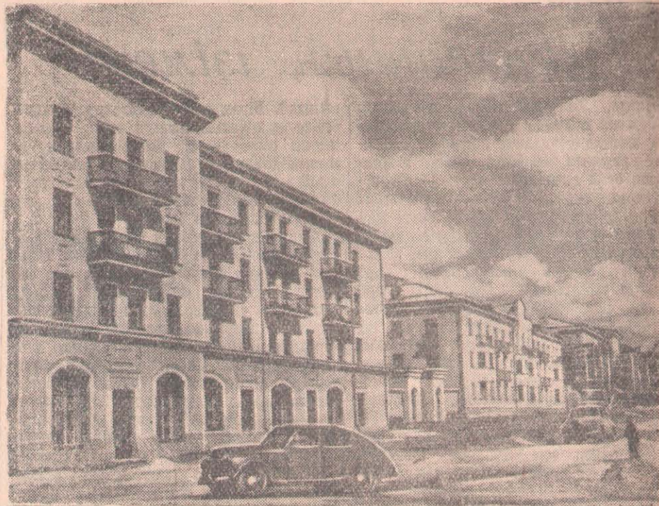
Бесінші бесжылдықтың үшінжарым жылы ішінде Қарағанды облысының еңбекшілері 485 мың шаршыметр тұрғын алаңдарын алды, 30 мектеп, 17 аурухана, поликлиникалар мен әйелдер босанатын үйлер, 20 балалар бақшасы мен яслилері, бірнеше кинотеатрлар мен клубтар салынды. Үстіндегі жылы қарағандылықтар тағы да 178 мың шаршыметр тұрғын алаңдарын алатын болады. СҮРЕТТЕ: Қарағанды қаласындағы Бейбітшілік бульварының бойында №1 шахтаның кеншілері үшін салынған жаңа тұрғын үйлер. (ҚазТАГ-тың фотохроникасы).