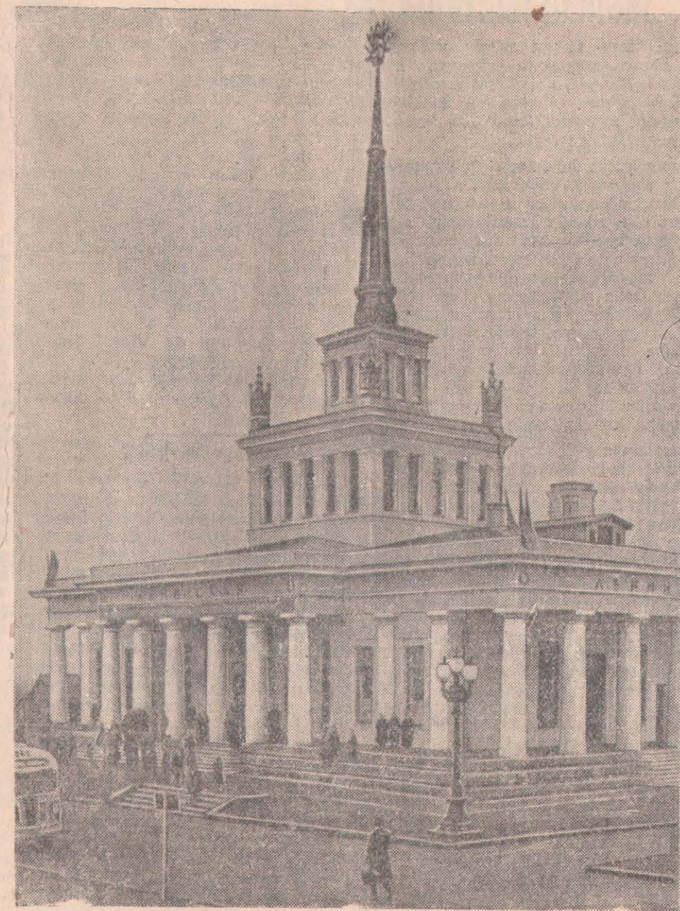
Москва облысы. Жуырда Москва-Курск-Донбасс темір жолының Ленин станциясында вокзал-ескерткіштің салтанатты ашылуы болды. СУРЕТТЕ: Ленин станциясында вокзал-ескерткіштің үйі. (СОТА-ның фотохроникасы).

Кәсіпорындар жыл басынан бері 370 мың метр жүн матаны тапсырмаға қосымша қосып шығарды. Еңбек өнімділігін арттыру жөніндегі 11 айлық тапсырма асыра орындалды.