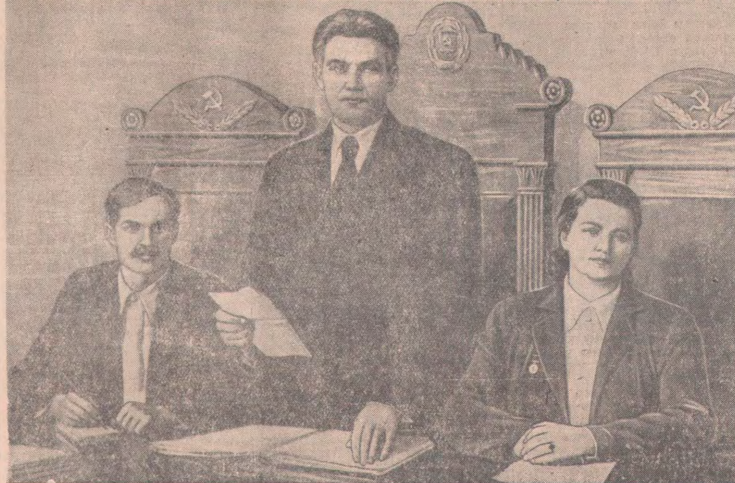
Мемлекеттік бейнелеу искусство баспасы шығарған суретші В. Белополюскийдің планаты.

рады қатып, қорықпай отырып, таға салды.