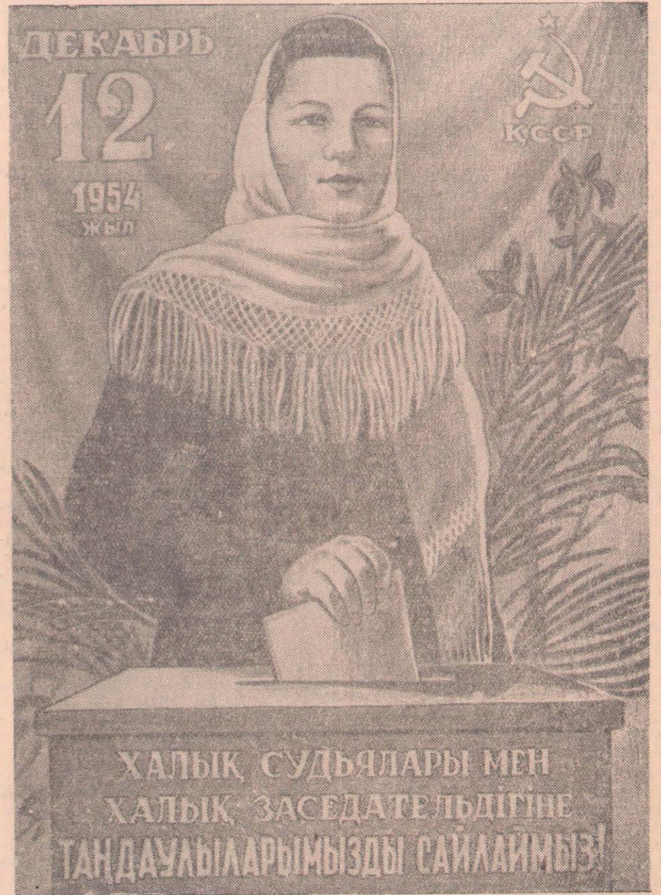
Суретші И. Лукиннің жасаған плакаты.