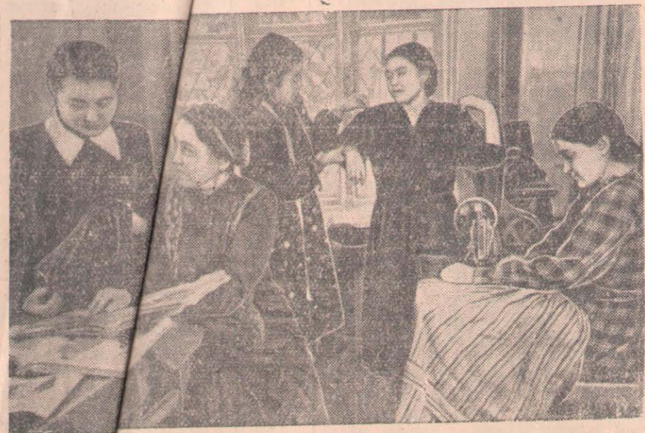
Алматы Қазақтың педагогикалық әйелдер институтында 650 қазақ қыздары жоғары білім алуда. Негізгі сабақпен бірге олар қолөнер шеберліктерін де үйренеді.