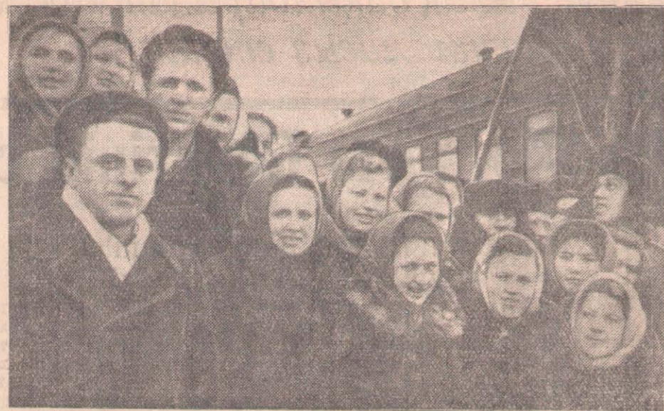
Москвалық комсомолецтерді петропавлдықтар қуанышпен қарсы алды. Вокзал перроны халыққа лық толды.

Мен ұлы Отанымыздың астанасы — Москвадан сіздерге тың және тыңайған жерлерді толқын астықты өлкеге айналыдыруға келген комсомолецтердің бірімін. Астанада Петропавлға үш күн жол жүріп келдім. Жолашыбай Солтүстік Қазақстанның пайдаланылмай жатқан көп жерлерін өз көзімізбен көрдік. Біз туысқан Коммунистік партияның шақыруымен алыстағы Москвадан осы жерлерді астық