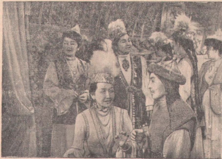
«Қозы-Көрпеш және Баян-Сұлу» фильмінен кадр.

Митингтен бейін демонстрация басталды, оған қаланың 200 мыңнан аса халқы қатысты.