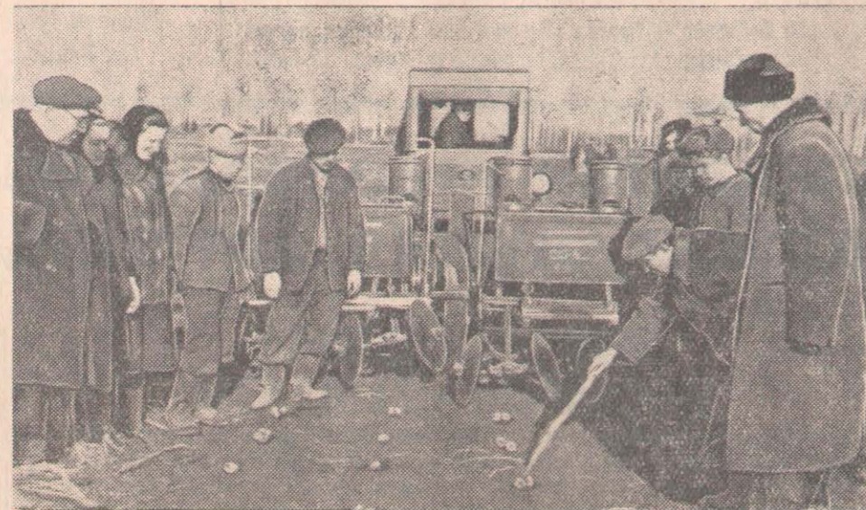
Петропавл ауданының Асанов МТС-і картопты шаршы-ұялап отырғызатын СКГ-4 екі сеялкасын алды. Осы машиналардың құрылысымен және жұмысымен таныстыру үшін МТС жанынан машинистердің курсы ұйымдастырылған еді. Курсты 18 адам бітіріп шықты.

Біздің облыстың ауа райы жағдайына байланысты кыяр тұқымы әдетте май айының аяқ кезінде себіледі. Совхоз овощь өсірушілері быыл қала халқына