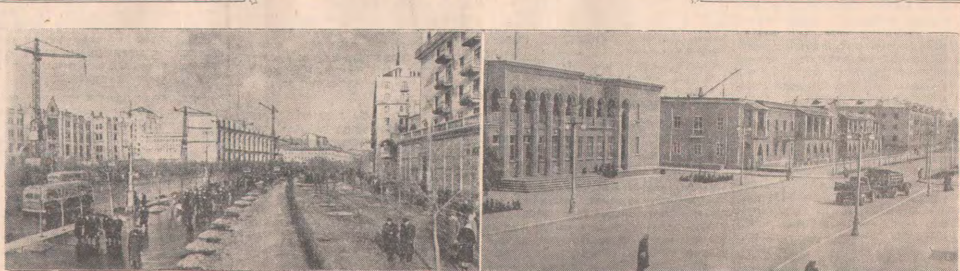
СУРЕТТЕ: (солдан оңға қарай) 1. Киев. Қаланың орталық магистралі —Крещатик. 2. Азербайжан ССР-і. Металлургтер қаласы —Сумгаитте үлкен құрылыс жүргізілуде. Быйыл мұнда 4 мектеп, 5 балалар бақшасы, медицина қалашығы, қолөнер училищесі, мәдениет үйі, байланыс үйі салынып бітеді. 40 мың шаршы метр тұрғын үйлер пайдаланылуға беріледі.