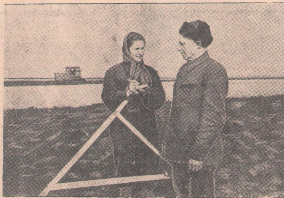
Булаев астық совхозы көктемде зір трактор бригадалары жытылған СУРЕТТЕ: (солдан оңға қарай) Норикова және үшінші участоктің жытылған жерді өлшеп қабылдап жүр.

Сыртқы істер министрлерінің Женева кеңесі (4-бет).