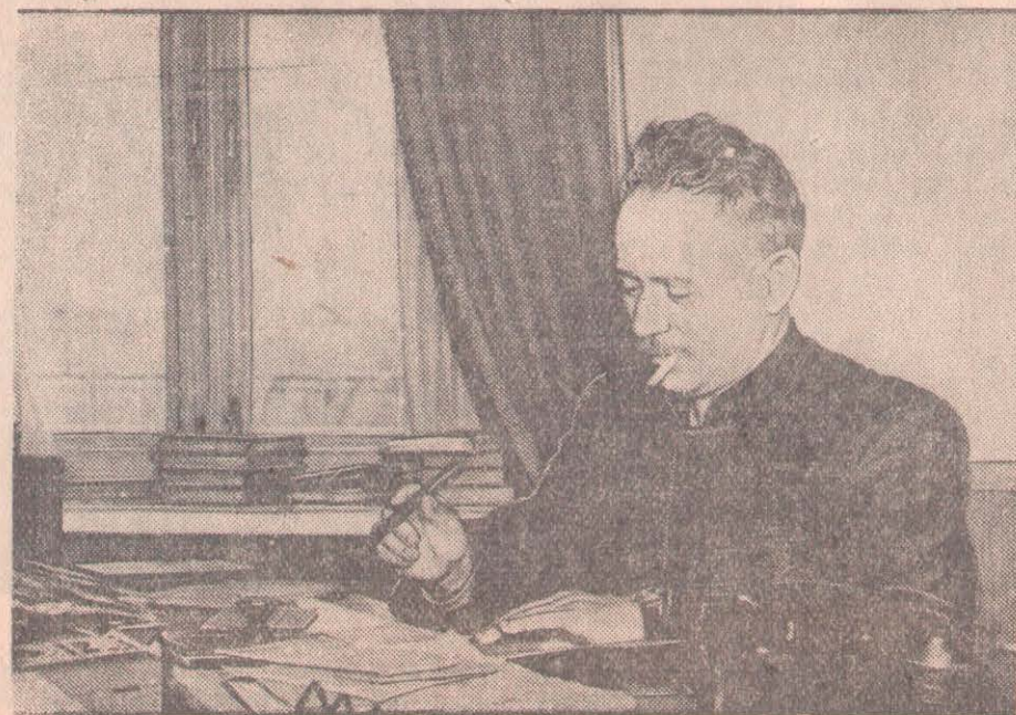
Жазушы М. А. Шолохов Вешенск станицасындағы өз кабинетінде жұмыс істеп отыр.

(М. А. Шолоховтың туғанына 50 жыл толуына)