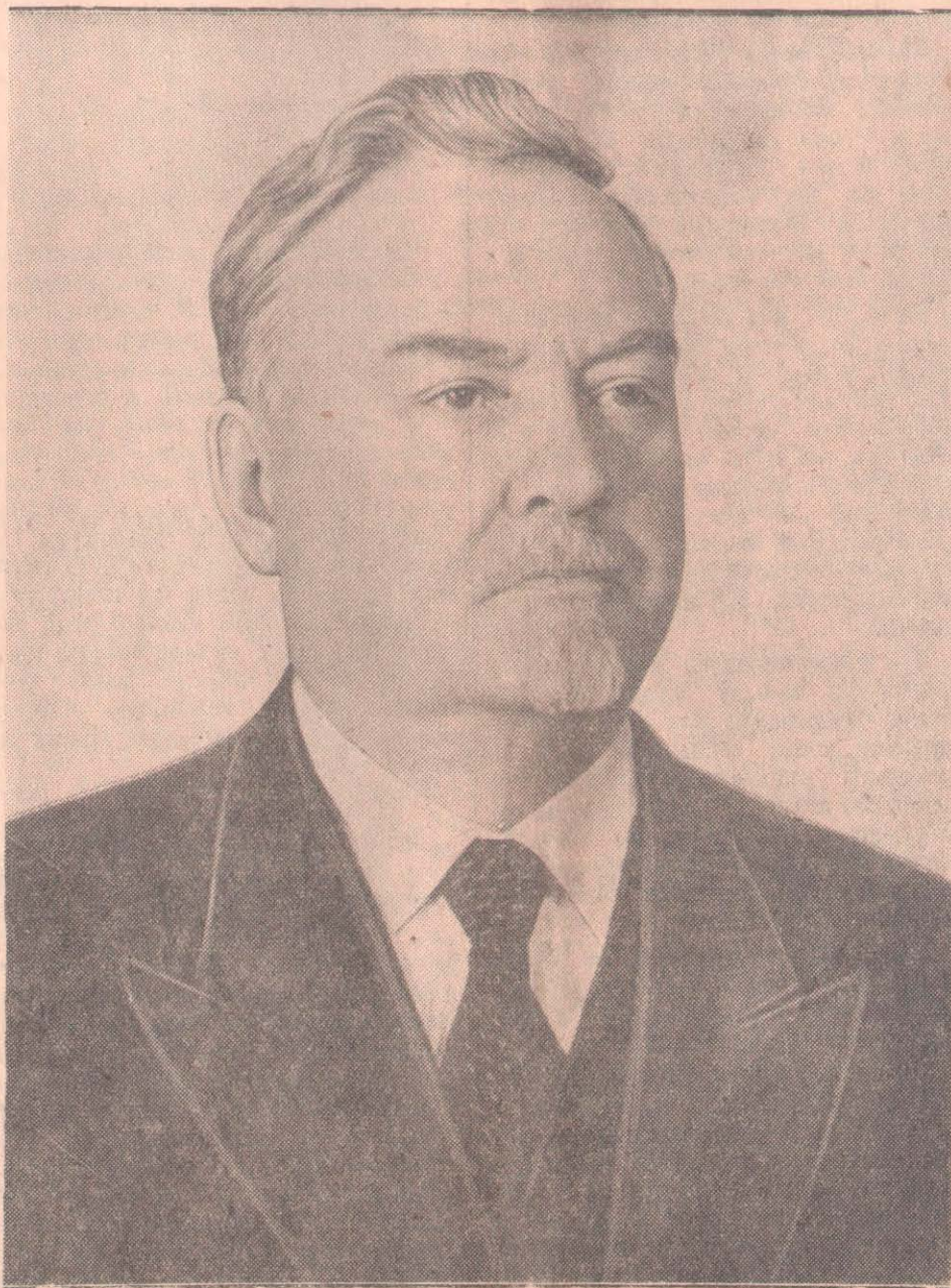
НИКОЛАЙ АЛЕКСАНДРОВИЧ БУЛГАНИН

СОКП Орталық Комитетінің ячварі Пленумы елімізде астықтың жалпы түсімін 1960 жылға дейін жыл сайын кемінде 10 миллиард пұтқа жеткізу, ал мал шаруашылығының негізгі өнімдерін екі есе және екі еседен де артық өндіру міндетін қойып отыр. Бұл міндеттерді мұлткісіз жүзеге асыруға елеулі үлес қосу үшін облысымыздың совхоздары орын алып келген кемшіліктерді батыл жоюлары қажет. Сонымен бірге совхоз басшылары мен мамандар және олардың бастауыш партия ұйымдары, жұмысшылар комитеттері совхоздардағы шаруашылық жұмыстарды негізінен жақсартудың, ауылшаруашылық дақылдарының шығымдылығын, мал шаруашылығы өнімділігін арттырудың, осының негізінде мемлекетке астықты, етті, сүтті, жүнді және басқа ауылшаруашылық өнімдерін көп тапсырудың шараларын жүзеге асырулары тиіс. Өнімнің өзіндік құнын мықтан кемітіп, әрбір совхоздың рентабельді жұмыс істеуін, сөйтіп, олардың үлгілі, мол