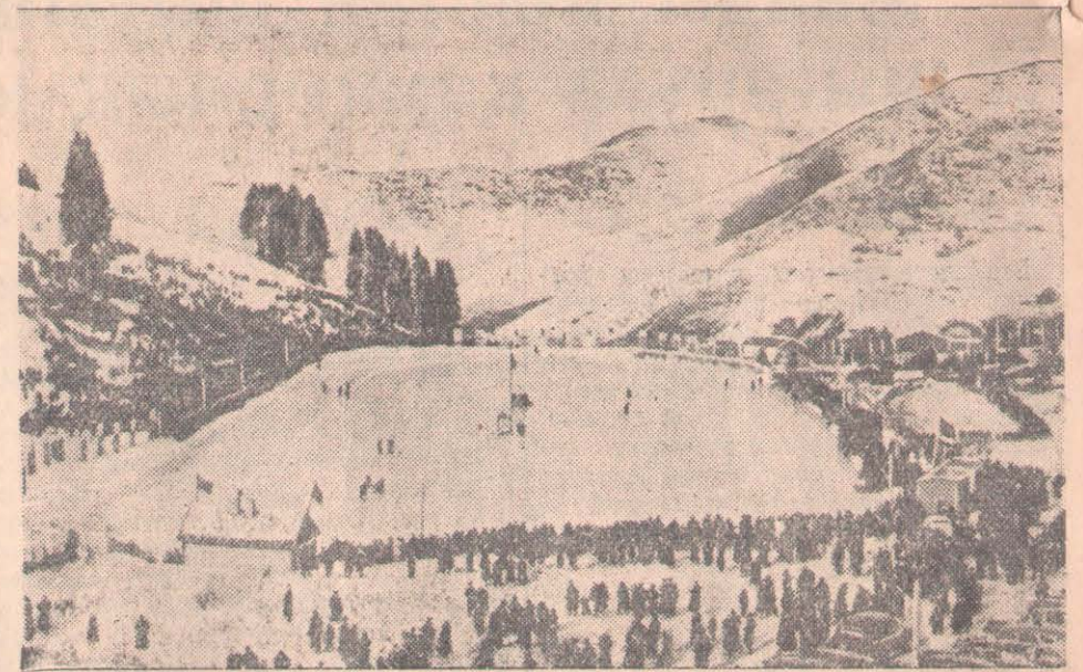
Алматы «Искра» ерікті спорт қоғамының мұз айдынында Қазақ ССР Министрлер Советінің жүлдесін алуға арналған конькишілердің жарысы болып өтті. СУРЕТТЕ: жарыс ашылған күнгі мұз айдынының жалпы көрінісі. (ҚАЗТАҒ-ТЫҒ ФОТОХРОНИКАСЫ).

Баяндамашы 1955 жылда МТС-тердің алдында тұрған міндеттерді айта келіп, бұл жылы МТС-тердің алдында зор көлемді міндеттер тұрғандығын, олар өткен жылы жұмсақ жерге айналдырғанда 163 мың гектар жер жұмыстаған болса, быйғы жылы 234 мың гектар жер жұмыстауға тиіс екендігін хабарлаған. МТС жұмыспен быйғы жылы 14 мың гектар алаңға егін себіледі және өткен жылғыдан 150 мың центнер артық баспадан