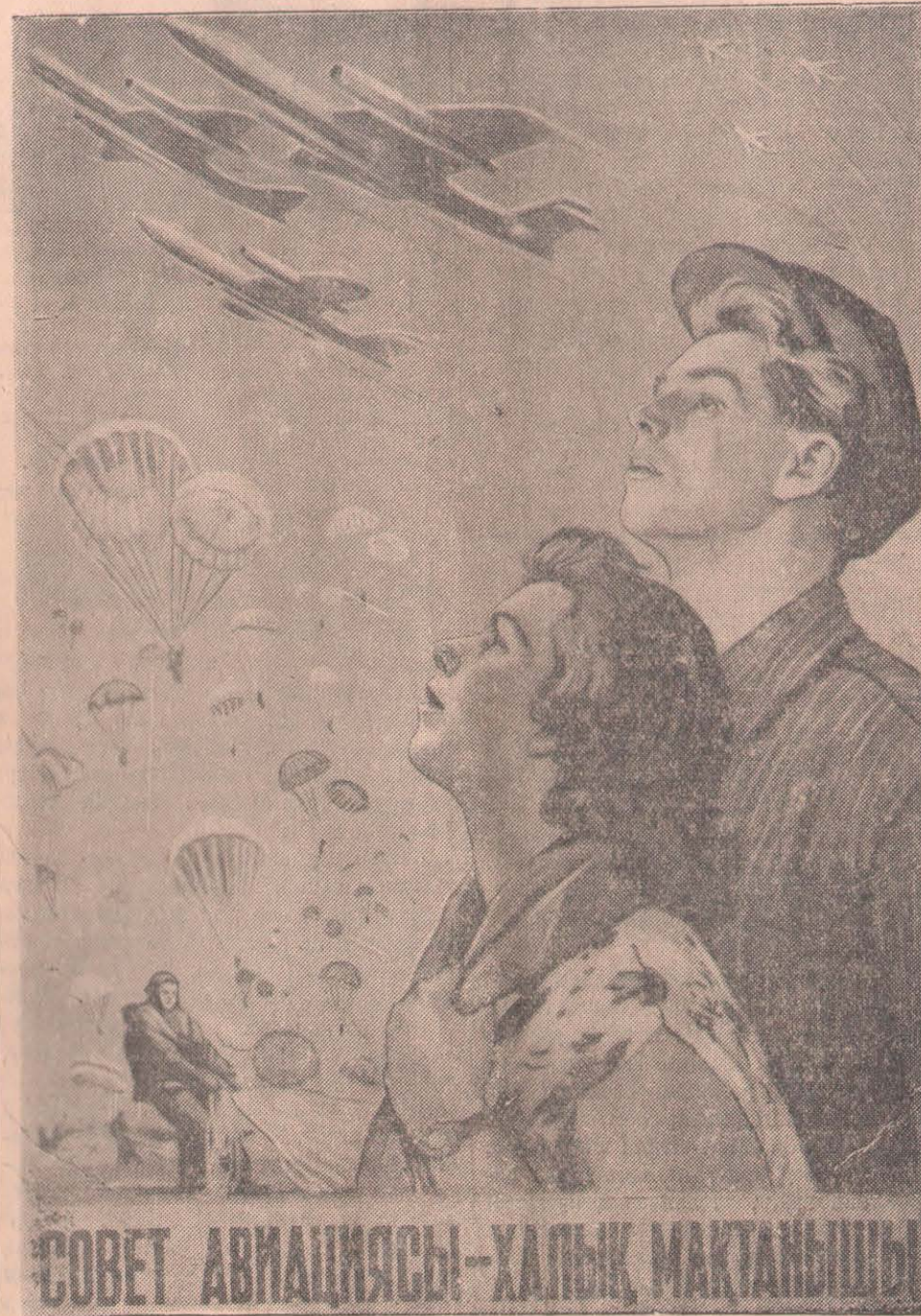
СОВЕТ АВИАЦИЯСЫ—ХАЛЫҚ МАҚТАНЫШЫ

Жемшөп дайындаудың барысына МТС-тер мен совхоздардың мал мамандары күнбе-күн нақтылы басшылық жасауға тиіс. Көп жерлерде мамандар бұл жұмысты өз міндеттері деп санамайтын болған. Бүгін бір мысал келтірейік. Тимирязев атындағы МТС-тің қамтуындағы Ворошилов атындағы, Сталин атындағы колхоздарда шөп шабу өте-мөте нашар ұйымдастырылған. Бұларда шөп шабу мен маялаудың арасында көптеген алшақтыққа жол берілуде. Бұл колхоздарда МТС-тер